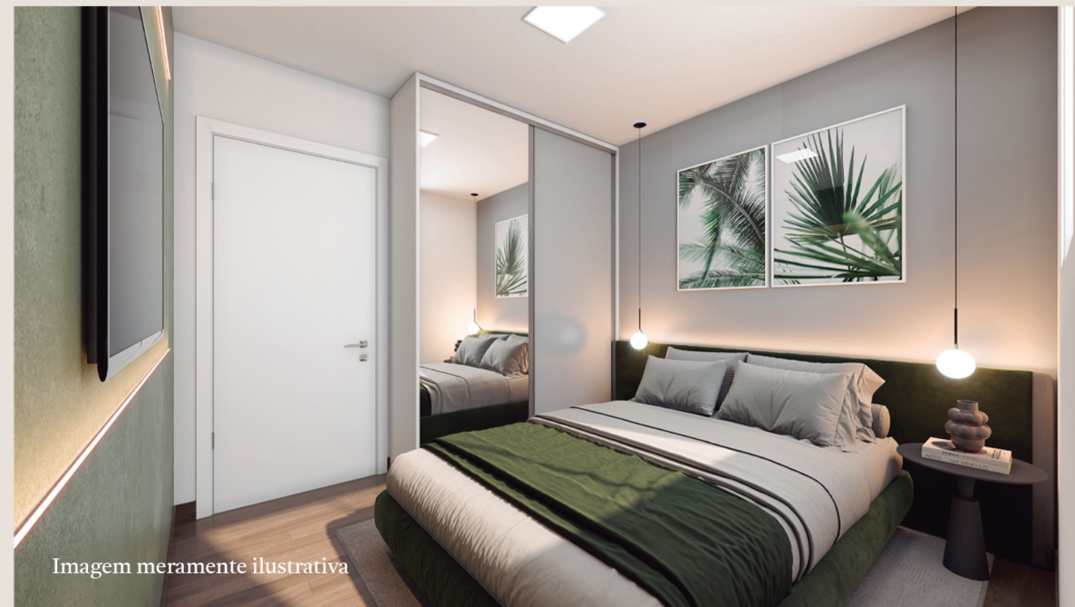
Dormitório secundário com 9,01m 2