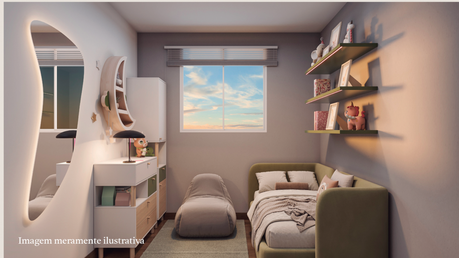
Dormitório principal com 7,65m 2