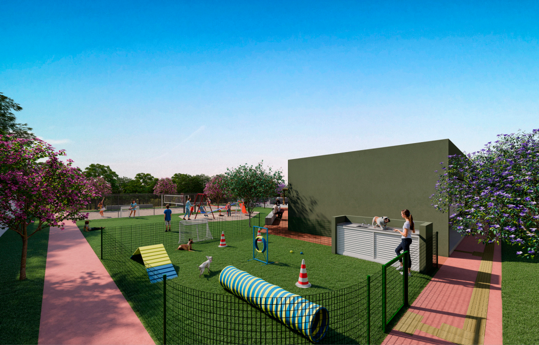
Pista de caminhada e pet place